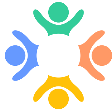
La vie communautaire (loisirs, culture,...)