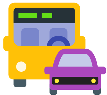
L'organisation du transport