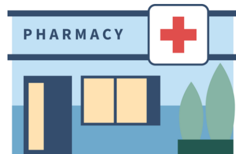
L'accessibilité aux services de proximité