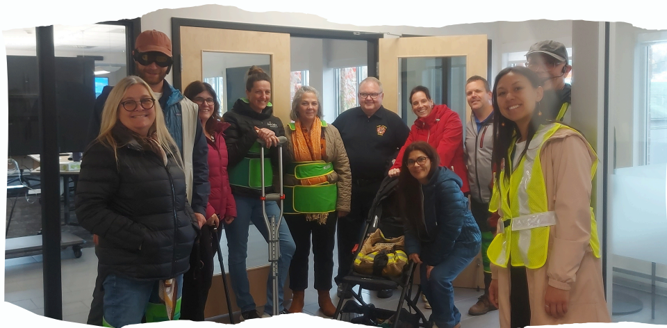
formation piéton québec

Les directions municipales, professionnels en aménagement et agents de développement présents ont pu identifier des pistes concrètes pour améliorer la sécurité et l'accessibilité des rues et des traverses piétonnes.