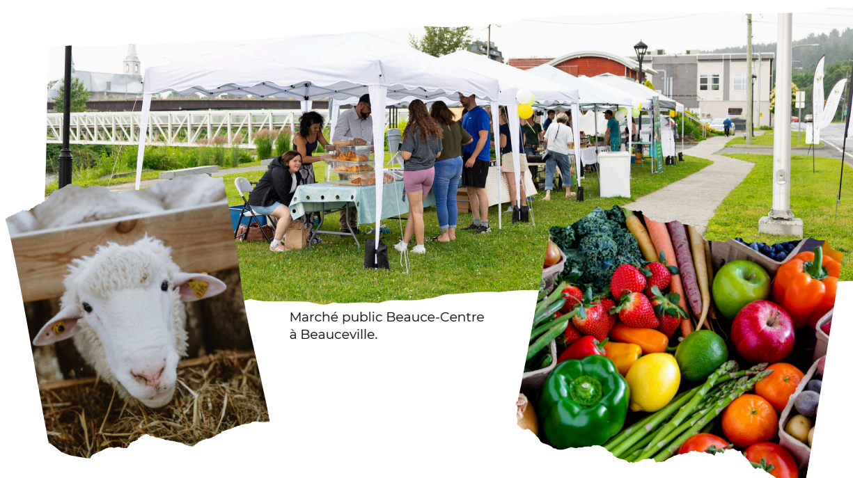
Marché public Beauce-Centre à Beauceville.