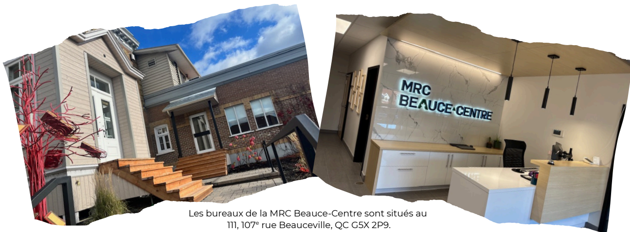
Les bureaux de la MRC Beauce-Centre sont situés au 111, 107 e rue Beauceville, QC G5X 2P9.

L'équipe administrative assure la mise en œuvre des décisions, la gestion des programmes et le soutien aux municipalités.