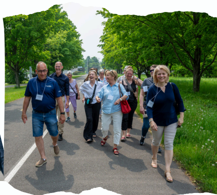
Tournée de milieux de vie en action