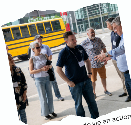
Tournée de milieux de vie en action